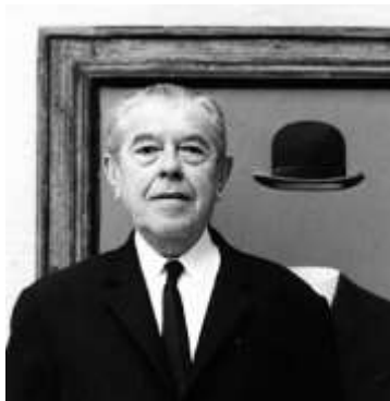
Magritte în fața lucrării sale din 1967, Pelerinul