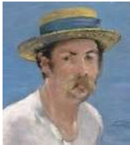
Edouard Manet în Barcă (detaliu)

Oare de unde îmi vine numele? De la bărbații care vâsleau în ambarcațiuni mici și ușoare, când curentul impresionist era în floare. Sunt o pălărie tare de paie, cu fundul și borurile drepte, numai bună de purtat la soare. Cu panglică sau nu, tot frumoasă sunt. Cea mai faimoasă lucrare în care apar se numește Bal la Moulin de la Galette și a fost pictată de Pierre-Auguste Renoir în 1876. În această sală figurez în două picturi realizate de Aman la aproximativ 2-4 ani, și la 12 ani după lucrarea artistului francez. Mă găsești măcar într-una dintre ele?