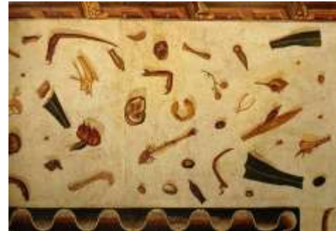
Camera nemăturată Mozaic roman de secol II

Primele naturi statice pot fi întâlnite în arta egipteană încă din mileniile 3-2 î.H.? Mai apoi naturile statice sunt redată în arta Romei antice (așa cum este mozaicul din secolul 2 d. H., intitulat Camera nemăturată ), în arta medievală europeană (când descriu și simbolizează însușirile sfinților) și mai târziu, prin secolele 14—15 în Italia, Țările de Jos, Germania.